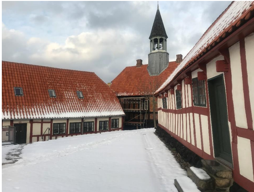
Det Gamle Rådhus er p.t. lukket pga. ombygning